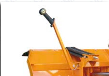
justierbare LED - Pflugbegrenzungsleuchten