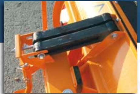
Rückholung der Pflugschar durch Spezial - Gummi- elemente (über 30 Jahre Erfahrung!)