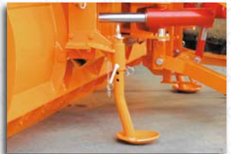
Höhenverstellbarer Schleifschuh oder Gleitkufe